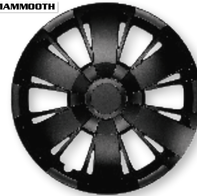
OMEGA BLACK MMT A112 2047B 15"