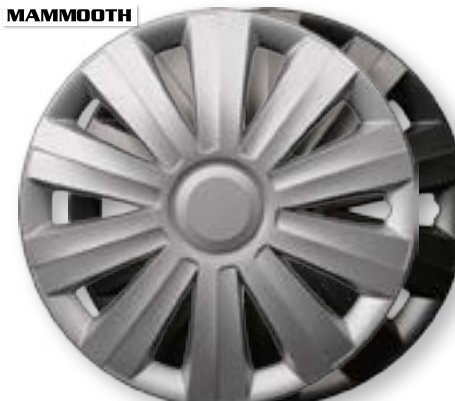
SNAKE, SNAKE BLACK MMT A112 2041, 2041B 13", 14", 15", 16"