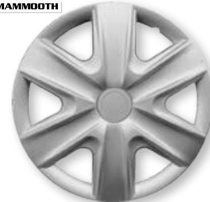
HEXAN MMT A112 2038 14", 15", 16"