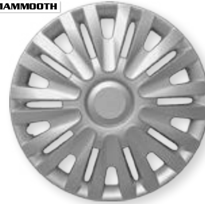
ALPHA MMT A112 2046 14", 15", 16"