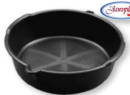
MISKA NA ZUŽYTY OLEJ JAWO 2015