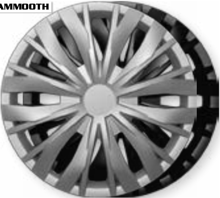
OPTIC, OPTIC BLACK MMT A112 2045, 2045B 14", 15", 16"