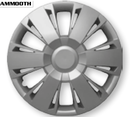
OMEGA MMT A112 2047 14", 15", 16"