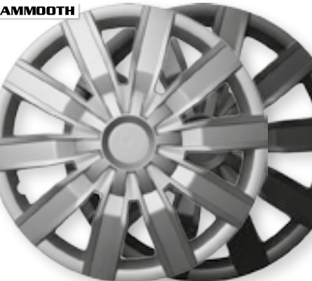
VOLARE, VOLARE BLACK MMT A112 2044, 2044B 14" 15" 16" 16"