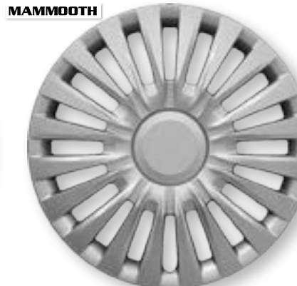
VENTO MMT A112 2042 13", 14", 15", 16"