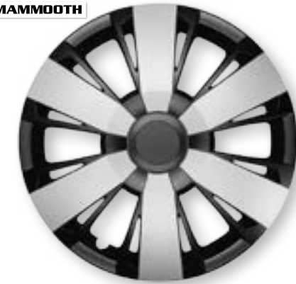
OMEGA DUO MMT A112 2047D 14", 15", 16"