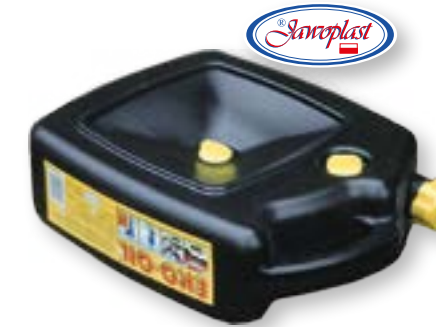
POJEMNIK ECO-OIL JAWO 2013