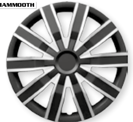
VOLARE DUO MMT A112, 2044D, 14", 15", 16"