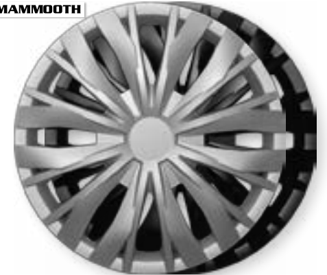
OPTIC, OPTIC BLACK MMT A112 2045, 2045B 14", 15", 16"