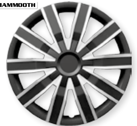
VOLARE DUO MMT A112, 2044D, 14", 15", 16"