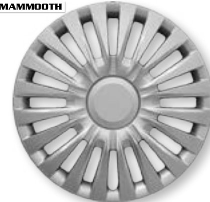
VENTO MMT A112 2042 13", 14", 15", 16"