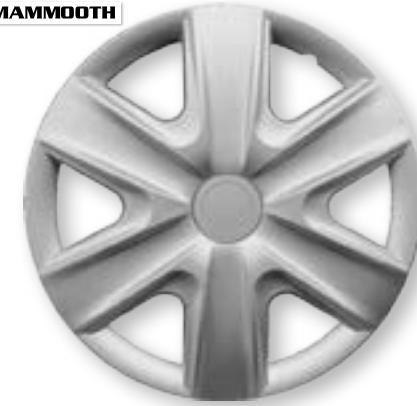
HEXAN MMT A112 2038 14", 15", 16"