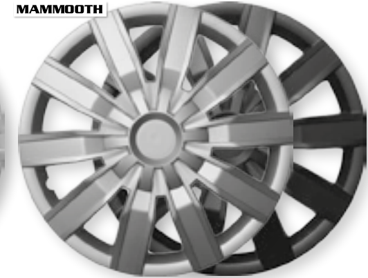
VOLARE, VOLARE BLACK MMT A112 2044, 2044B 14" 15" 16" 16"