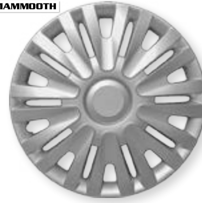
ALPHA MMT A112 2046 14", 15", 16"