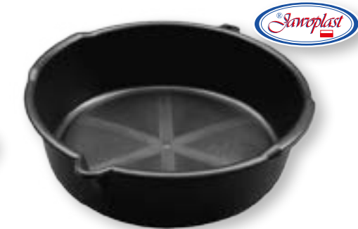
MISKA NA ZUŽYTY OLEJ JAWO 2015