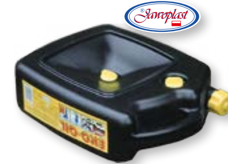
POJEMNIK ECO-OIL JAWO 2013