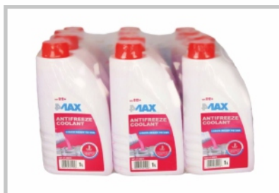
4MAX jahutusvedeliku komplekt G12+ (12 X 1l)