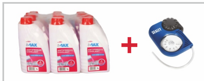
4MAX jahutusvedeliku komplekt G12+ (12 X 1l) ja SEALEY jahutusvedeliku tester