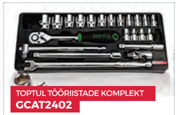
TOPTUL TÕÕRIISTADE KOMPLEKT GCAT2402