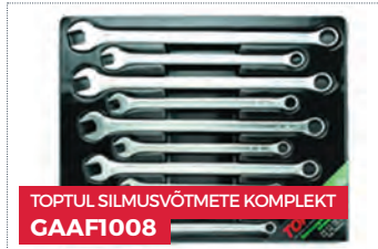
TOPTUL SILMUSVÕTMETE KOMPLEKT GAAF1008