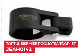
TOPTUL SISEMISE ROOLIOTSA TÕÕRIIST JEAH0142