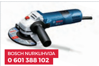
BOSCH NURKLIHVIIJA 0 601 388 102