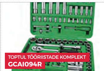
TOPTUL TÕÕRIISTADE KOMPLEKT GCAI094R