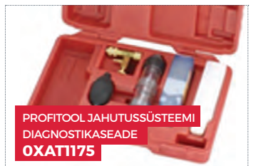
PROFITOOL JAHUTUSSÜSTEEMI DIAGNOSTIKASEADE OXATI175