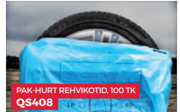
PAK-HURT REHVIKOTID, 100 TK QS408