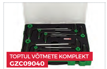
TOPTUL VÕTMETE KOMPLEKT GZC09040