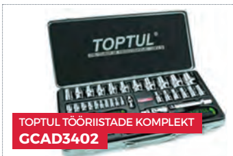
TOPTUL TÕÕRIISTADE KOMPLEKT GCAD3402