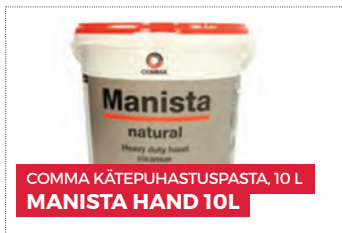
COMMA KÄTEPUHASTUSPASTA, 10 L MANISTA HAND 10L