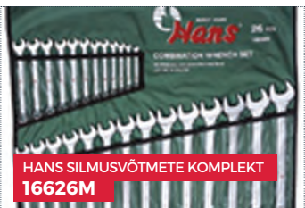
HANS SILMUSVÕTMETE KOMPLEKT 16626M

Kõik kliendid, kelle summaarne ostusumma Perioodi jooksul on võrdne või ületab 500 EUR (ilma käibemaksuta), saavad valida kingituse all olevate toodete hulgast: