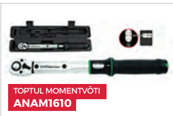
TOPTUL MOMENTVÕTI ANAM1610