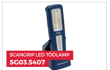
SCANGRIP LED TÖÖLAMP SG03.5407

2.2. Ühel võitjal on õigus ainult ühele kingitusele. Kingitust ei asendata teist liiki kingitustega ega hüvitata rahas.