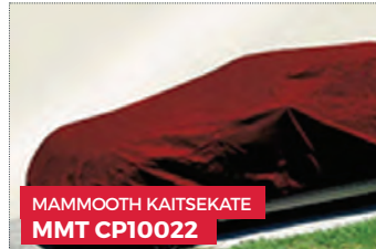
MAMMOOTH KAITSEKATE MMT CP10022