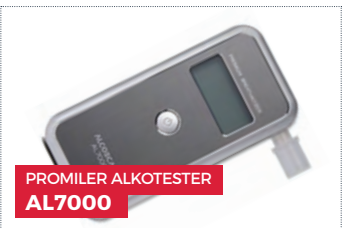
PROMILER ALKOTESTER AL7000