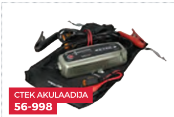
CTEK AKULAADIDJA 56-998