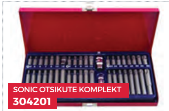
SONIC OTSIKUTE KOMPLEKT 304201

2.1. Kõik kliendid, kelle summaarne ostusumma Perioodi jooksul on vahemikus 200 EUR – 499 EUR (ilma käibemaksuta), saavad valida kingituse all olevate toodete hulgast: