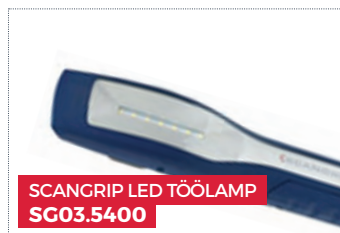
SCANGRIP LED TÖÖLAMP SG03.5400