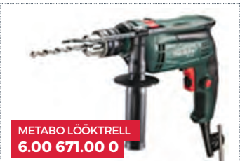
METABO LÖÖKTRELL 6.00 671.00 0