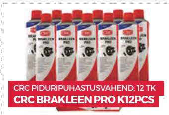
CRC PIDURIPUHASTUSVAHEND, 12 TK CRC BRAKLEEN PRO K12PCS

Kõik kliendid, kelle summaarne ostusumma Perioodi jooksul on võrdne või ületab 500 EUR (ilma käibemaksuta), saavad valida kingituse all olevate toodete hulgast: