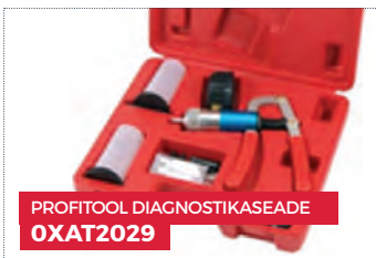
PROFITOOL DIAGNOSTIKASEADE OXAT2029